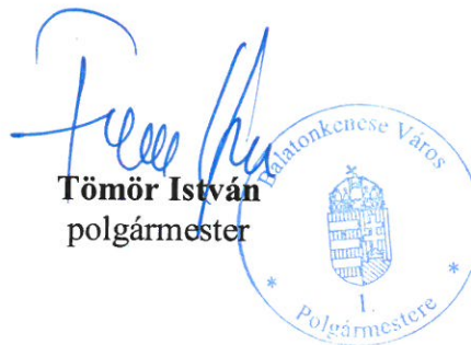
Tömör István polgármester

Határozat-tervezet: Balatonkenese Város Önkormányzata Képviselő-testületének ...../2017. (XI. 30.) határozata